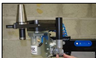
Vidéo de démonstration